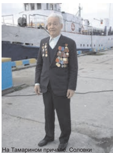
На Тамирином причале. Соловки