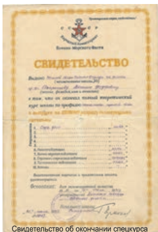
Свидетельство об окончании спецкурса