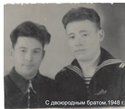
С двоюродным братом. 1948 г.

Потому что никто не забыт и ничто не забыто.