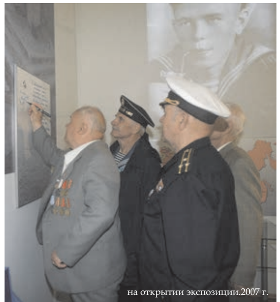
на открытии экспозиции. 2007 г.

Я теперь работаю комментатором Российской государственной компании «Маяк». Хотел бы пожелать Соловецкому радио и всем соловчанам, чтобы они имели право говорить и чувствовать то, что думают; чтоб старались не врать людям. Надо объединиться, сдвинуться, иначе будет хана, безо всякой войны. И даже юнги не помогут.