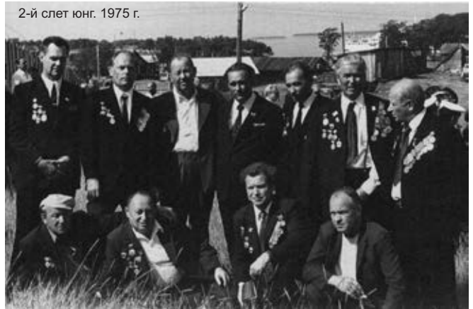
2-й слет юнг. 1975 г.