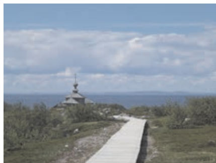
Дорога к храму.