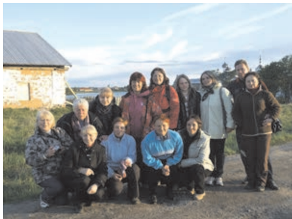
Кондопожский краеведческий клуб на Соловках.

В кондопожской городской поселенческой библиотеке (республика Карелия) открылась фотовыставка «Соловки – острова Преображения», приуроченная к 45-летию Соловецкого государственного историко-архитектурного и природного музея-заповедника.