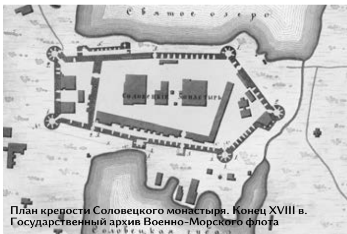
План крепости Соловецкого монастыря. Конец XVIII в.

Отсюда стремление русского правительства укрепить ключевые позиции на Белом море. В 1584 г. воздвигаются деревянный острог и пристань в Архангельске, ставшим впоследствии главным портом страны на севере. После изменения русско-шведской границы Ладога оказалось гораздо ближе к неприятелю, чем прежде. Ее оборонительные сооружения пришлось усиливать в срочном порядке. В 1585-1586 гг., вскоре после оконча-