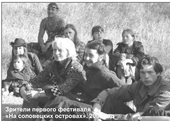
Зрители первого фестиваля «На соловецких островах». 2000 год