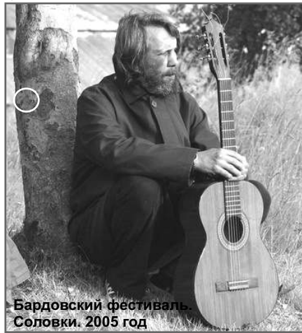
Бардовский фестиваль. Соловки. 2005 год

– Православие и творчество – понятия самостоятельные. Православными бывают только вера, церковь и человек. Православные