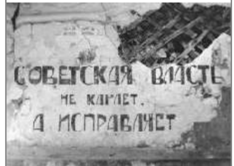
«Советская власть не карает, а исправляет» – надпись в келейном корпусе в Савватеево.