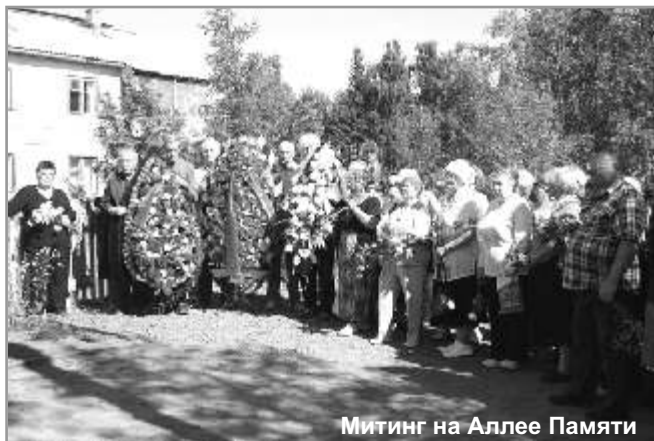
Митинг на Аллее Памяти

Центральным событием Дней памяти станет Круглый стол, на котором участники представят результаты своей деятельности по сохранению исторической памяти о политических репрессиях.