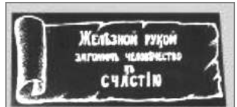
«Железной рукой загоним человечество к счастью» – советский лозунг начала 1920-х годов