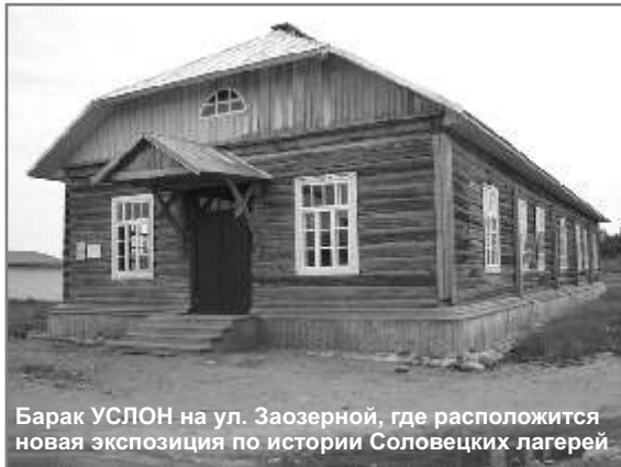
Барак УСЛОН на ул. Заозерной, где расположится новая экспозиция по истории Соловецких лагерей

На Круглом столе сотрудники Соловецкого музея-заповедника расскажут о новом большом проекте в данной сфере, цель которого – организация на музейной базе научно-исследовательского, информационного, культурного и мемориального Центра изучения ГУЛАГа и сохранения памяти его жертв. В настоящее время в рамках этого проекта ведется активная работа по созданию новой экспозиции по истории Соловецких лагерей.