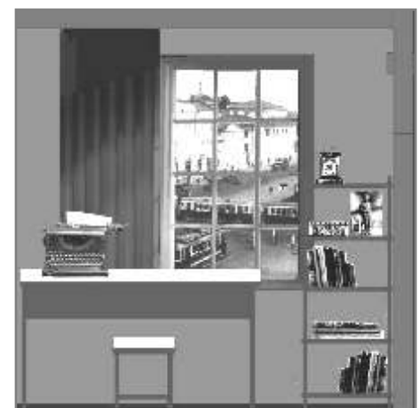
Макет кабинета следователя

СЛОНа в 1937 году. Эмоциональной доминантой экспозиции должен стать последний зал – зал памяти о трагических судьбах всех узников Соловков и системы ГУЛАГа.