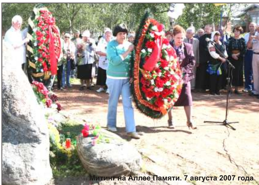
Митинг на Аллее Памяти. 7 августа 2007 года