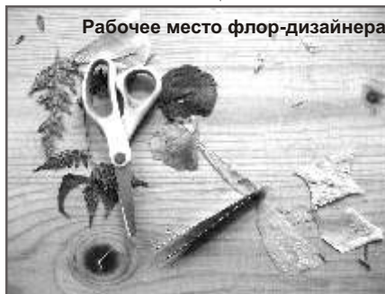
Рабочее место флор-дизайнера

«В первый день занятий мы познакомимся, потом пойдем, насобираем природных материалов. Поговорим, как и что плести, а затем сядем все вместе, и будем плести. В результате должно явиться панно – достаточно большое, 2,5 на 2,5 метра – под названием «Соловецкое солнце». Оно будет выполнено из природных материалов, и дети, даже зимой, будут видеть мир своей природы. Все вокруг занесено снегом, холодно, за окнами темно, а в школе все равно будет кусочек Ботанического сада, здесь все равно будет островочек чего-то природного, родного, где будут и мхи, и травы полевые, и водоросли, и камушки...» «Соловецкое солнце» буде освещать актовый зал Соловецкой школы.