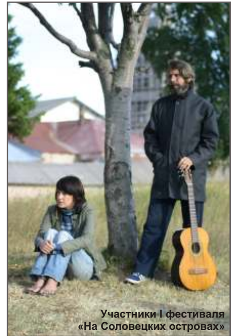
Участники I фестиваля «На Соловецких островах»

ПРИГЛАШАЕМ ВСЕХ ЖЕЛАЮЩИХ! ВХОД НА МЕРОПРИЯТИЯ ФЕСТИВАЛЯ СВОБОДНЫЙ!