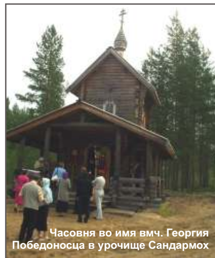
Часовня во имя вмч. Георгия Победоносца в урочище Сандармох