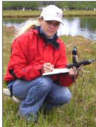
4 Мониторинг природы подтвердил гипотезу