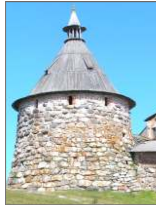
6 Семь чудес России