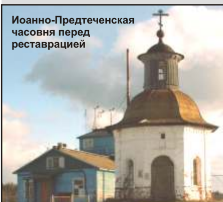
Иоанно-Предтеченская часовня перед реставрацией

(По материалам исторической справки «Историко-архитектурные памятники поселка «Соловки», Т.М. Кольцова, Ю.М. Критский).