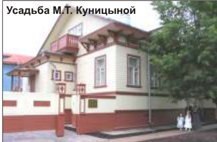
Усадьба М.Т. Куницыной

В открытом информационном центре посетители смогут получить всю необходимую информацию о деятельности музеев. Установленный сенсорный киоск содержит сведения о культурном и природном наследии региона, основных событиях музейной жизни, экскурсиях, экспозициях, сервисном обслуживании.