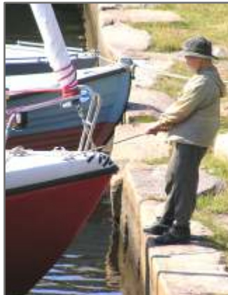
2 «На регату может повлиять только отсутствие ветра»