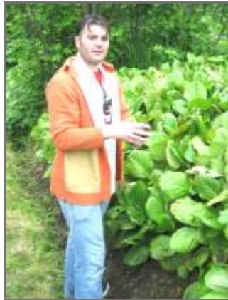
3 В Сирии тоже растет щавель