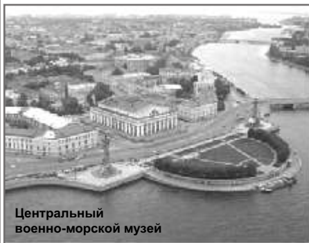
Центральный военно-морской музей

Центральный военно-морской музей, г. Санкт-Петербург