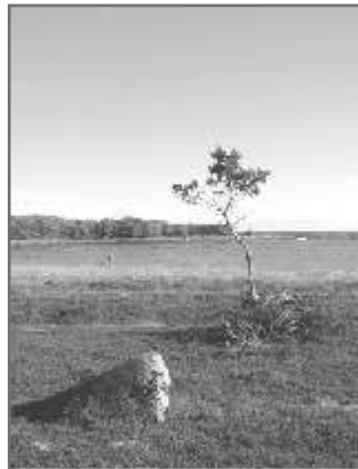
3 Изучать, чтобы сохранять