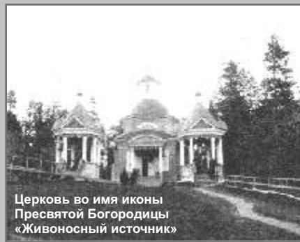
Церковь во имя иконы Пресвятой Богородицы «Живоносный источник»

ЖИВОНОСНЫЙ ИСТОЧНИК ФИЛИППОВСКОЙ ПУСТЫНИ