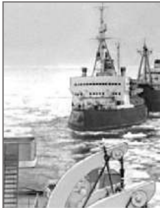
2 Наши на Новой Земле