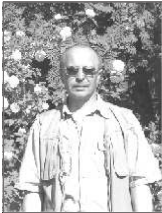
2 Гражданская служба подполковника ЗАПАСА