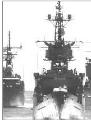
4 Военно-морская история России