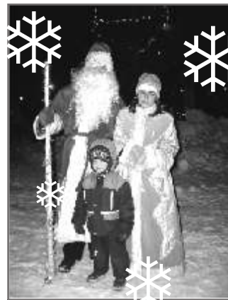
8 Новогодние праздничные мероприятия