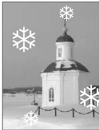
7 Крайсветное счастье