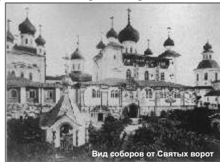
Вид оборов от Святых ворот

Яков Иванович Лейцингер хорошо известен жителям Архангельской области. Как общественный деятель он неоднократно избирался гласным Архангельской городской думы, а с 1903 года в течение десятилетия был городским головой. Но больше он известен как прекрасный фотограф, оставивший после себя огромную коллекцию уникальных снимков Архангельска, архитектурных и исторических памятников, северных монастырей, жителей Севера конца XIX - начала XX веков. Многие из этих снимков, в том числе и снимки, сделанные Я. Лейцингером на Соловках в 1895 и 1911 годах, широко известны, они публиковались в книгах, фотоальбомах, издавались в форме открыток. 62 фотографии, которые представлены в подготовленном областным краеведческим музеем и отпечатанном в издательстве «Правда Севера» фотоальбоме «Соловки 1888 г.», публикуются впервые. Все они взяты из фотальбома, который Я. Лейцингер собственноручно датирует 1888 годом. Альбом этот, как гласит надпись, сделанная фотографом, был подарен