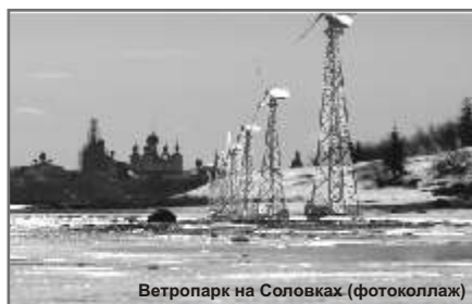
Ветропарк на Соловках (фотоколлаж)

«Поскольку Соловецкие острова являются уникальным природным заповедником, в сохранности его экосистемы заинтересованы как россияне, так и норвежцы», — добавил заместитель губернатора. В рамках подготовки к реализации проекта у руководства губернии Тромс есть намерения вновь посетить Архангельскую область и Соловки в 2006 году. Летом этого года делегация губернии побывала сначала в Архангельске, а затем на Соловках. В будущем году визит начнется с посещения архипелага, куда норвежцы придут не по воздуху, а по воде, на пароме.