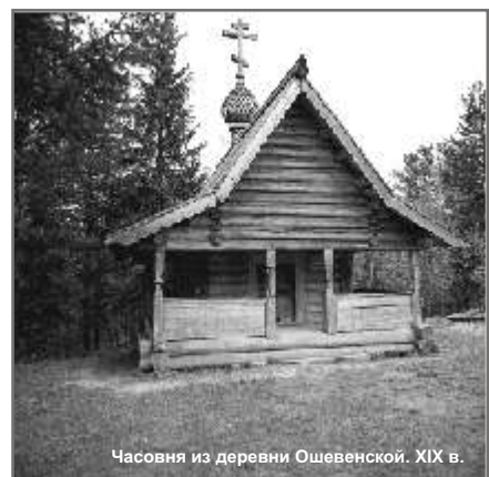
Часовня из деревни Ошевенской. XIX в.

Русский Север – край таежный. Истари крестьяне рубили здесь из сосны и лиственницы избы-великаны, баньки, амбары, колодцы, ветряные мельницы, возводили островерхие громады шатровых храмов. Все это нашло свое выражение