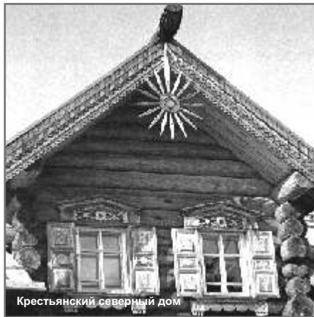
Крестьянский северный дом

Музей деревянного зодчества – это выразительный образ, символ Русского Севера. Так он и воспринимается северянами. Он кажется монументальной легендой, но хранит для каждого свое, родное, теплое – память о Малой Родине.