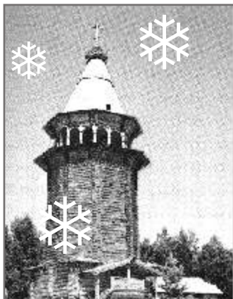
5 Малые Корелы – большой музей