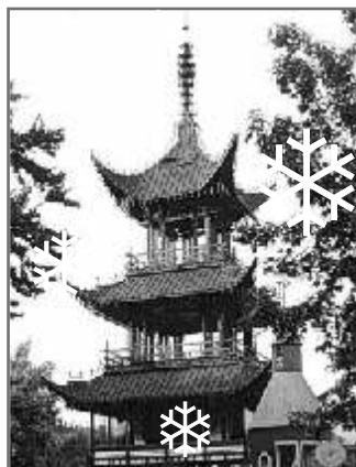
6 Загадочная японская душа