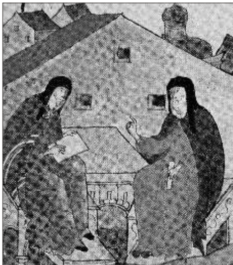
Соловецкие книжники Спиридон и Досифей за работой. Фрагмент миниатюры.

Периодическое издание Соловецкого государственного историко-архитектурного и природного музея-заповедника № 7 (39), сентябрь 2005