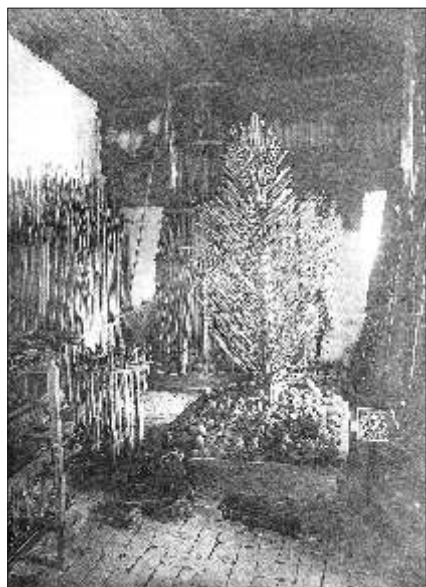
Внутренний вид Успенской башни с древним оружием

не хотим никого из иноверцев на Московское государство царем великим князем опричь своих природных бояр Московского государства». В это тревожное время в монастыре и его острогах находилось более тысячи воинов.