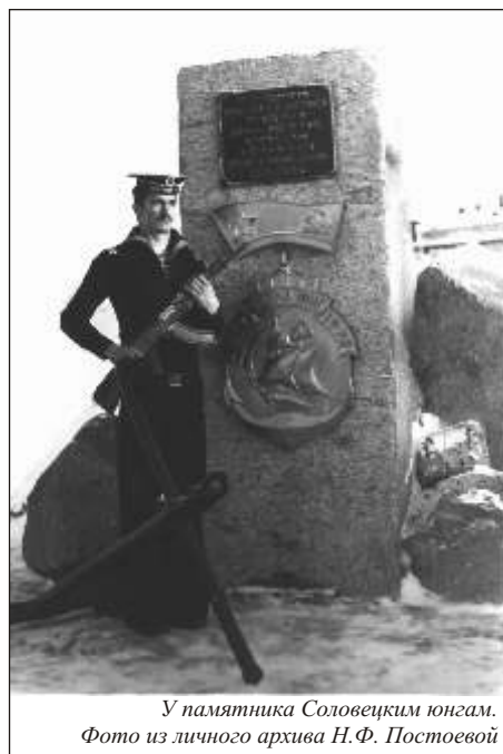
У памятника Соловецким юнгам.

Соловчане считают – такой праздник нужен России.