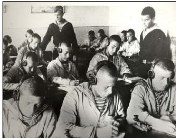
Радисты на занятиях. Первый набор Школы связи.

По данным картотеки школы юнг на 1975 г. 23 выпускника награждены медалью «Адмирал Ушаков», 12 – медалью