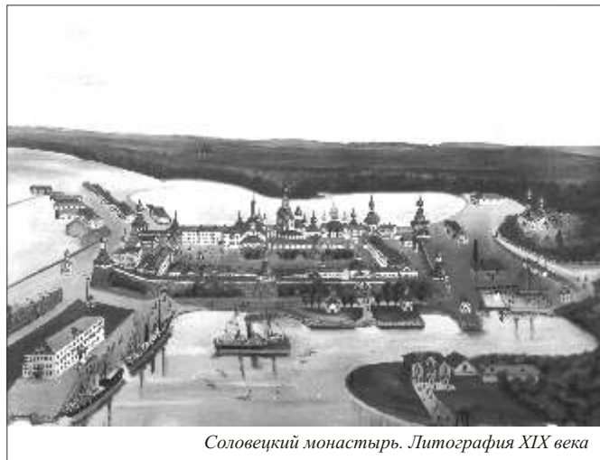
Соловецкий монастырь. Литография XIX века

Только в 1637 году, ввиду уменьшения опасности вражеского нападения, многочисленное соловецкое войско было ликвидировано, оборона Поморья перешла полностью в руки игумена.