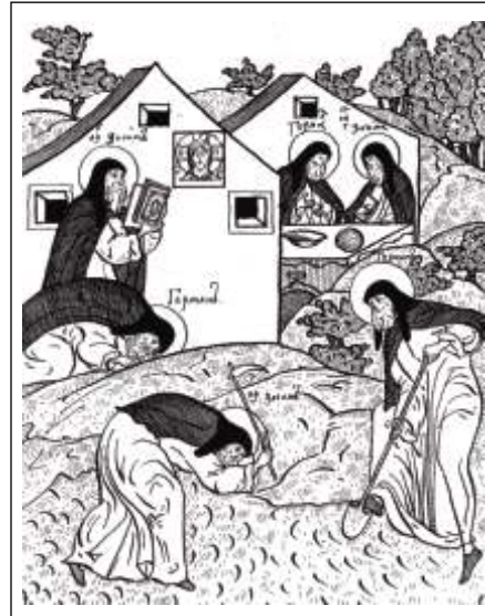
Миниатюра с выставки «Подвижники благочестия Соловецкого монастыря»

В течение второй половины июля – первой половины августа выставка была изготовлена и с помощью сотрудников представительства музея-заповедника в Архангельске доставлена на Соловки. Монтаж выставки осуществлялся также совместно. От музея в монтаже принимали участие сотрудники экспозиционного отдела