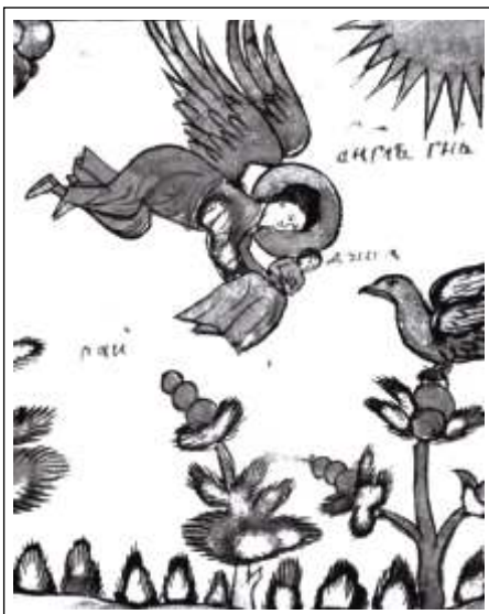
Миниатюра с выставки «Подвижники благочестия Соловецкого монастыря»

Был составлен и согласован план работы над выставкой.