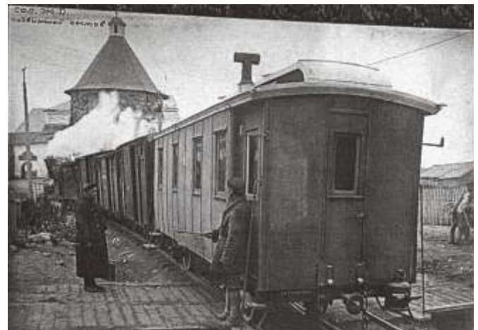
Из «Кировского альбома». Надпись на фотографии: «Сол. ж.д. Подвижной состав».

Строительство узкоколейной (750 мм) железной дороги на Соловках было вызвано хозяйственной необходимостью: