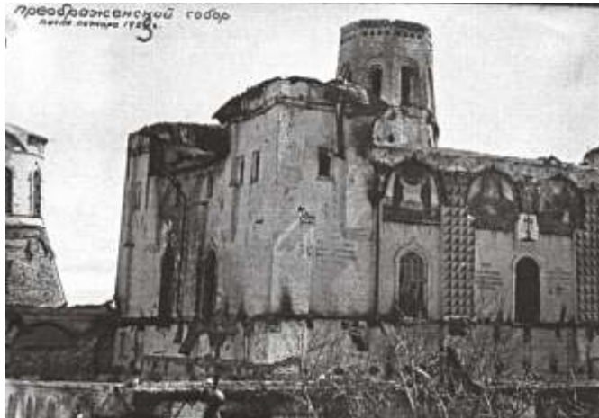
Из «Кировского альбома». Надпись на фотографии: «Преображенский собор после пожара 1923 г.»

26 мая 1923 года в помещении канцелярии совхоза начался пожар, быстро охвативший большую часть Соловецкого кремля. В результате пожара пострадали многие постройки центрального комплекса, огнем была полностью уничтожена контора, где хранилась документация совхоза, в том числе – документы об изъятии монастырских ценностей и «излишков» продовольствия.