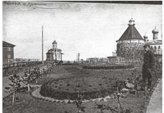
Из «Кировского альбома». Надпись на фотографии: «Дорога к Кремлю».

«Соловецкий архипелаг расположен в Онежской губе Белого моря, под 65° северной широты и 53° восточной долготы. Главный остров архипелага носит название Соловецкий. Кроме него в недалеком расстоянии расположены небольшие острова: Анзер, Большой и Малый Муксаломские, Заяцкие острова и многие другие».