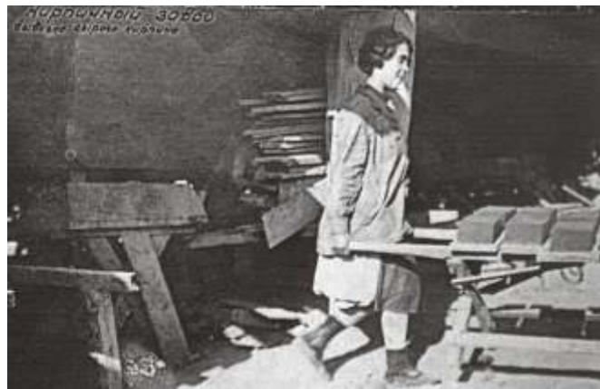
Из «Кировского альбома». Надпись на фотографии: «Кирпичный завод. Вывоз сырого кирпича».

Уникальный альбом, в котором представлено 150 фотографий, публикуется впервые. Альбом имеет следующие размеры: ширина 26,5 см, длина 37 см, толщина 6 см, размеры фотографий – 16-17 x 11-12 см. Все снимки наклеены на картонные страницы, фотографии подписаны от руки. Некоторые фотографии неровно обрезаны, часть снимков от времени и клея покорибилась. Эта особенность сохранена при публикации. В издание вошли 148 фотографий, исключены два дублирующих