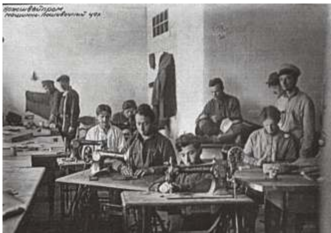
Из «Кировского альбома». Надпись на фотографии: «КОЖШВЕЙПРОМ. Машинно-пошивочный цех».

Кожевенное производство, наряду с кирпичным, принадлежало к старейшим отраслям соловецкого хозяйства. Кожевенный завод, созданный монахами, был кустарным предприятием. Его продукция славилась по всему Северу. В основном здесь выделывали шкуры морского зверя. В 1907 году кожевенный завод за выделанные шкуры нерпы получил в Бордо золотую медаль.