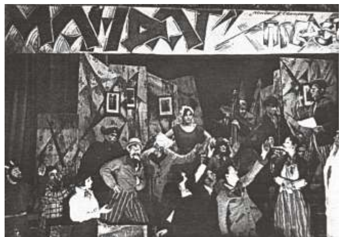
Из «Кировского альбома». Надпись на фотографии: «Мандат» в Солттеатре».

«Маленькая соловецкая труппа из заключенных сделала бы честь любому провинциальному городу. Бывшая монастырская трапезная передана под театр: небольшая сцена, уютный зал, фойе. По субботам и воскресениям дают платные спектакли, еще один, два раза в неделю – бесплатные для общих рот».