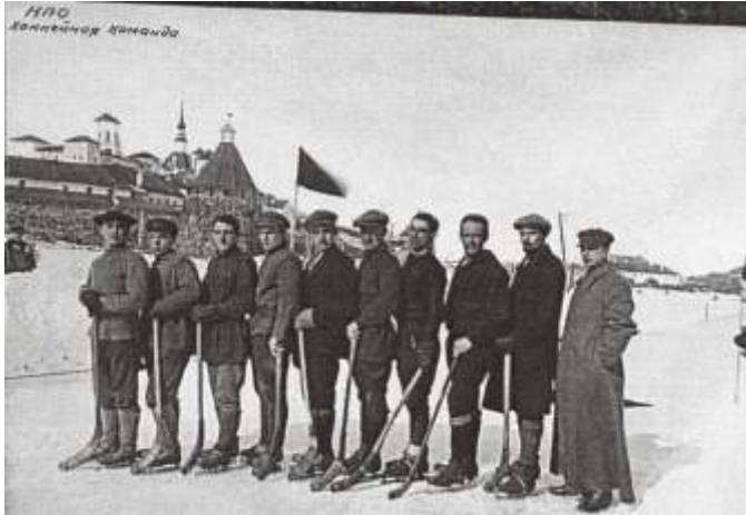
Из «Кировского альбома». Надпись на фотографии: «НПО. Хоккейная команда».

По данным журнала «Соловецкие острова», заключенные зимой занимались лыжами и коньками, летом в лагере действовало 10 футбольных команд, четыре баскетбольных, шесть волейбольных. Существовала даже женская волейбольная команда. Пользовались популярностью гребной спорт, плавание, гимнастика, игры (кегли, городки).