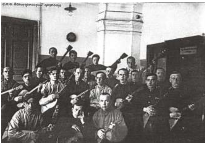
Из «Кировского альбома». Надпись на фотографии: «К.П.О. Великоорусский оркестр».

Одной из уставных задач советских концентрационных лагерей была «перековка» старого «человеческого материала» – «перевоспитание» трудом и «культурным отдыхом». Решение этой задачи в лагерях было возложено на КВЧ – культурно-воспитательную часть .