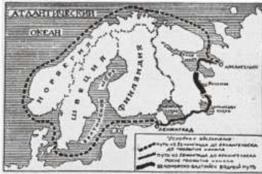
Иллюстрация из журнала «Прожектор». 1933. № 12 (330). С. 10

Весной 1930 года был создан Особый комитет по сооружению Беломорско-Балтийского водного пути при Совете Труда и Обороне.