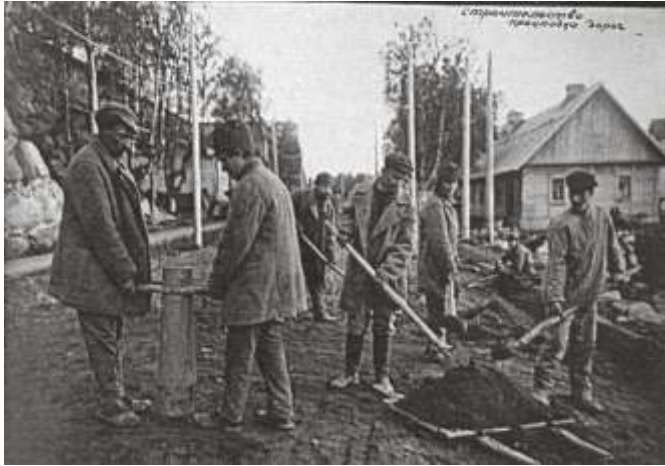
Из «Кировского альбома». Надпись на фотографии: «СТРОИТЕЛЬСТВО. Прокладка дороги».