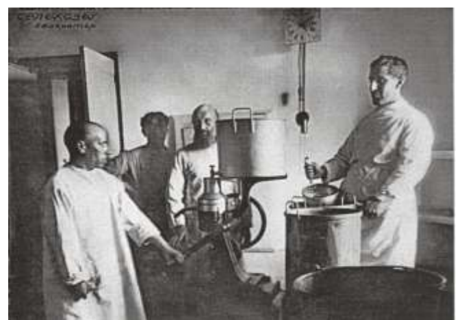
Из «Кировского альбома». Надпись на фотографии: «СЕЛЬХОЗЫ. Сепаратор».

«СОЛОВЕЦКИЕ ЛАГЕРЯ ЯВЛЯЮТСЯ ПИОНЕРАМИ ИНТЕНСИВНОГО СЕЛЬСКОГО ХОЗЯЙСТВА НА ДАЛЕКОМ СЕВЕРЕ. НЕСМОТРИ НА ОТСУТСТВИЕ ОПЫТА И ТРУДНЫЕ УСЛОВИЯ СОЛОВКИ ДАЛИ ТАКИЕ ОБРАЗЦЫ ПРОДУКЦИИ, КОТОРЫЕ ДОСТОЙНЫ БЫТЬ ЭКСПОНАТАМИ НА ВЫСТАВКЕ. МЕСТНОЕ НАСЕЛЕНИЕ, НЕ ВЕРИВШЕЕ В ВОЗМОЖНОСТЬ ВЕДЕНИЯ СЕЛЬСКОГО ХОЗЯЙСТВА, НАЧИНАЕТ ПЕРЕНИМАТЬ ОПЫТ СОЛОВКОВ И РАЗВИВАТЬ У СЕБЯ СЕЛЬСКОЕ ХОЗЯЙСТВО.»